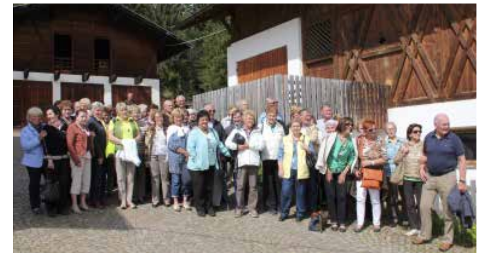
Meran am 6. Mai 2013