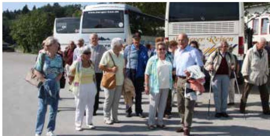
Frauenchiemsee am 6. Juli 2011