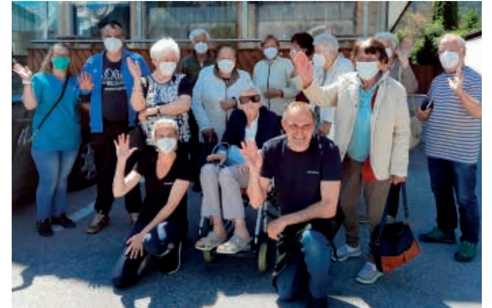
Große Freude bei den Besuchern des „Mittagstischs“.

Gesundheits- und Sozialsprengel westliches Mittelgebirge Mittelgasse 6, 6091 Götzens,