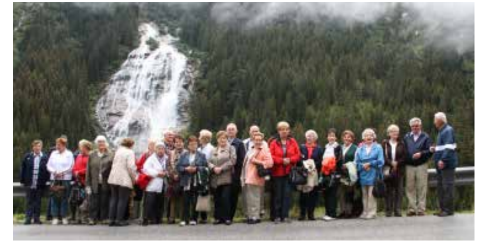
Grawa Wasserfälle am 24. August 2010