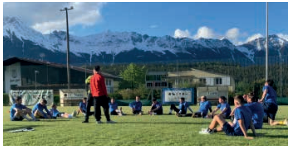
Ansprache beim Auftakt der Kampfmannschaft.

Es gilt festzuhalten, dass trotz der ganzen Umstände tolle Spiele geboten wurden und das angesprochene Ziel („ein einstelliger Tabellenplatz“) mit Bravour