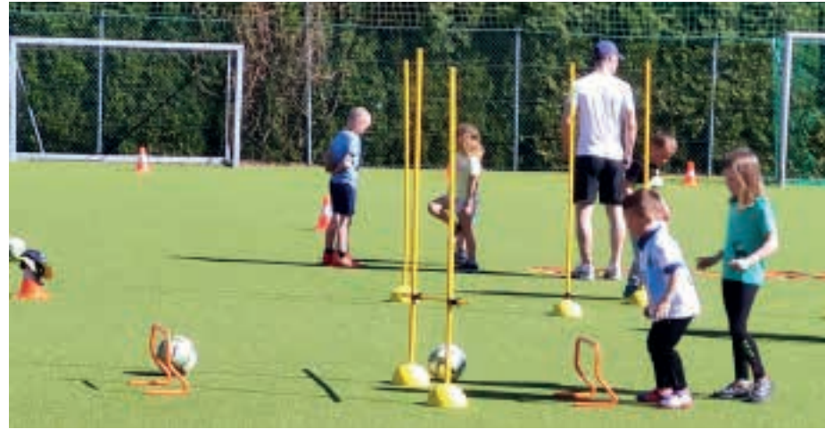
Hopp, hopp, hopp, jede Übung ist eine Challenge.

Da wir den „Natterer Weg“ fokussieren ist es für uns von Priorität, dass im Nachwuchs gute Arbeit geleistet wird, um längerfristig in der Tiroler Liga konkurrenzfähig zu bleiben. In der U8, U11, U14, U16 waren trotz langer Spielpause immer große Teilnahme an den Trainings und Freude an der Weiterentwicklung gegeben. Es freut uns, dass fast alle Kids dem heimischen Vereinssport treu geblieben sind, so dass wir nächstes Jahr wiederum neue Altersstufen beim TFV anmelden können. In der