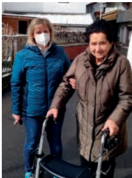
Mobile Pflege und Betreuung in Zeiten der Pandemie.

gestartet werden. Nicht nur „satt“, sondern das „Gemeinsame“ steht in unserer Mittagstischrunde im Vordergrund. Für nähere Auskünfte oder Vereinbarung von Beratungsgesprächen bitten wir Sie, uns telefonisch unter 05234/33080 oder per Mail unter kontakt@sozialsprengel-wm.at zu kontaktieren.