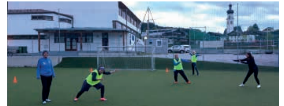
Das Training der Damen ist immer mit Spaß verbunden.