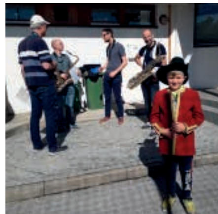
Kurzkonzerte für die Volksschule Natters.