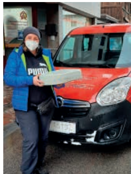
Essen auf Rädern.

gestartet werden. Nicht nur „satt“, sondern das „Gemeinsame“ steht in unserer Mittagstischrunde im Vordergrund. Für nähere Auskünfte oder Vereinbarung von Beratungsgesprächen bitten wir Sie, uns telefonisch unter 05234/33080 oder per Mail unter kontakt@sozialsprengel-wm.at zu kontaktieren.