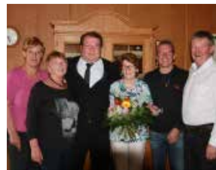
Annis 80. Geburtstag am 21. April 2014