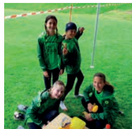
Unsere U13 Mädels beim Turnier in Inzing.

sondern überhaupt das erste Mal am Volleyballfeld. Loois und Tobi haben großartig gekämpft und jede Menge vielversprechender Ballwechsel geliefert. Noch am gleichen Tag waren die Mädels der U13