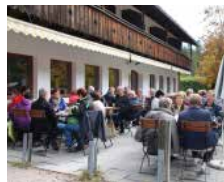
Ferchensee am 26. September 2017