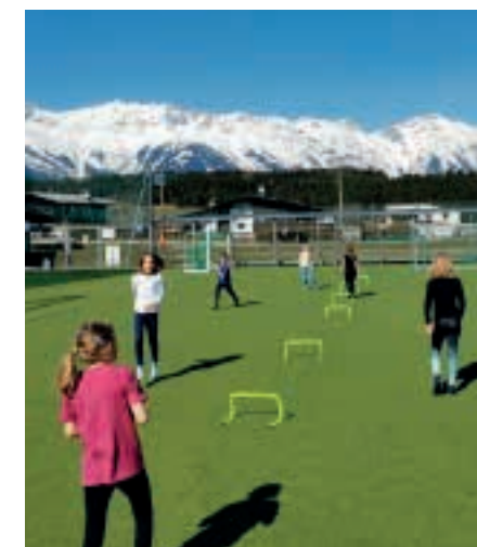
Eine Gruppe des Freitagstrainings in Action.

Nachdem wir im Herbst eine zwischenzeitliche Alternative zu KuK gefunden haben, sind unsere Trainings mit einer Unterbrechung wieder im vollen Gange! Seit Mitte März trainieren 2 Gruppen zu