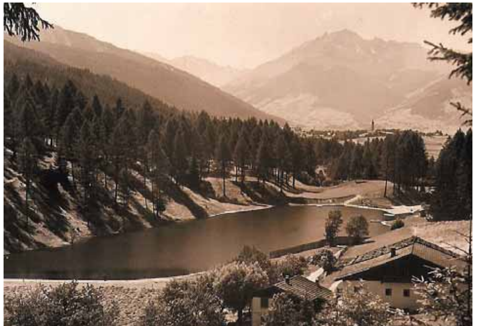
Natterer See gegen Westen 1932

Im Steuerkataster von Natters von 1775 und 1856 werden mehrfach Grundstücke „im See“ genannt. Zahlreiche Bauern bewirtschaftete-