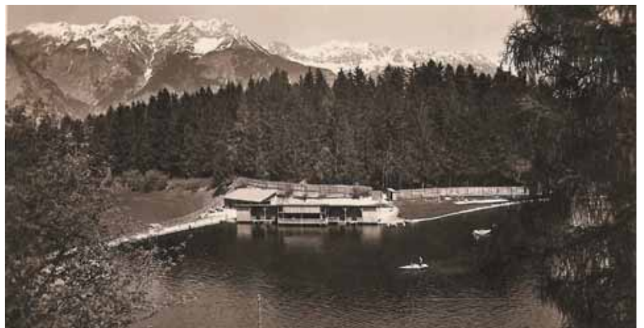
Natterer See gegen Norden 1932