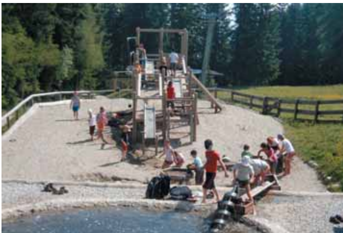
Ausflug auf die Muttereralm