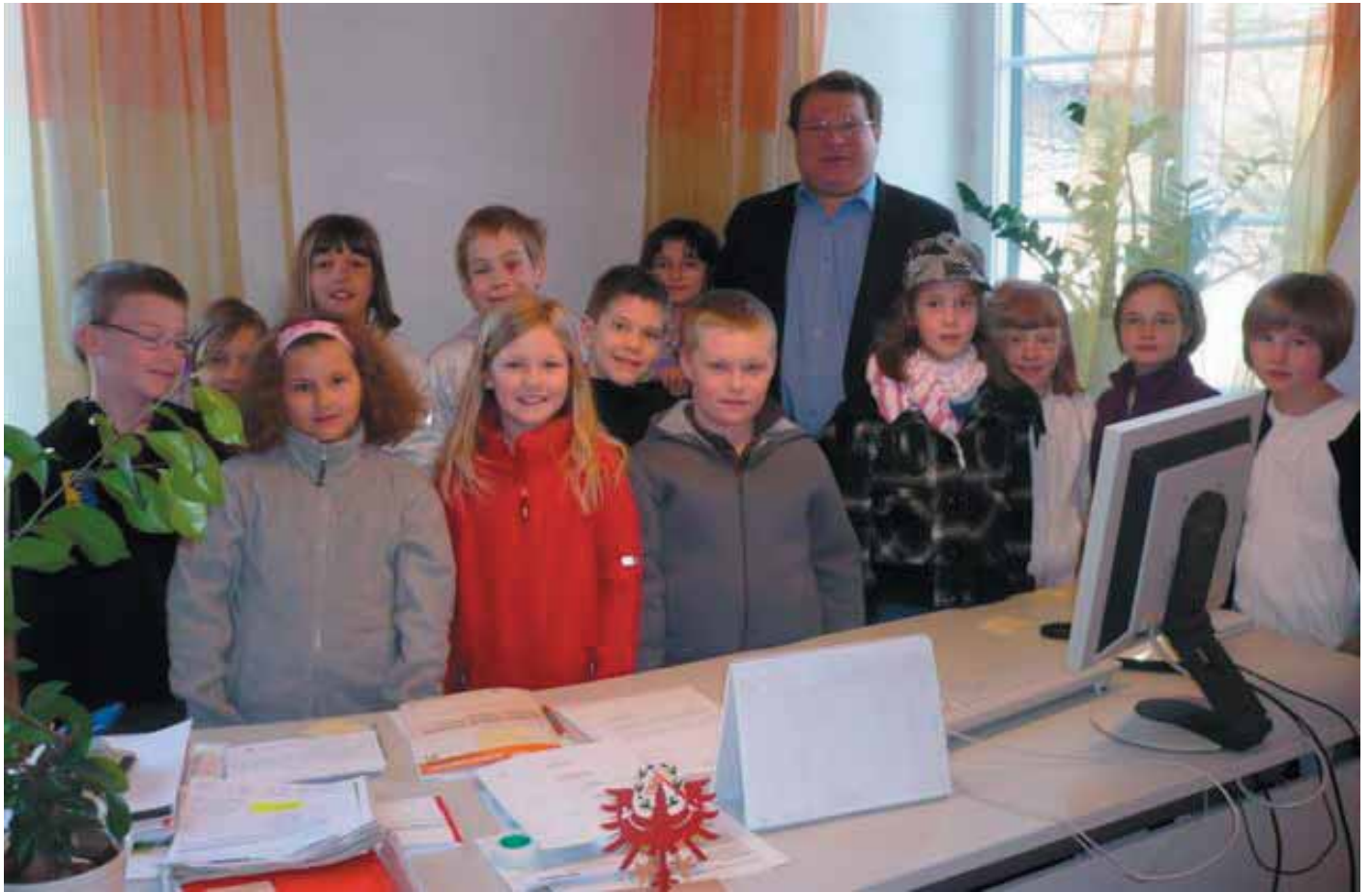
Besuch beim Bürgermeister