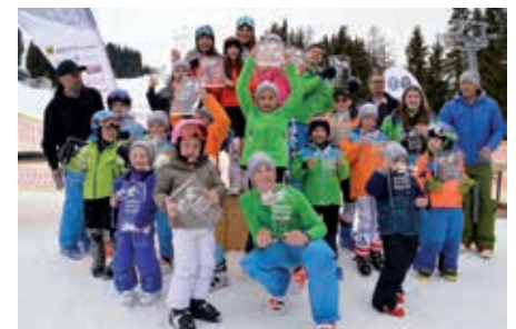
Die NSC 2018 Gesamtsieger_innen aller Klassen der beiden Vereine SVN und SCM

Die SVN Gesamtwertung findet ihr auf www.svnatters.at/schisnowboard/nockspitzcup , viele Fotos auf www.svnatters.at/fotos .