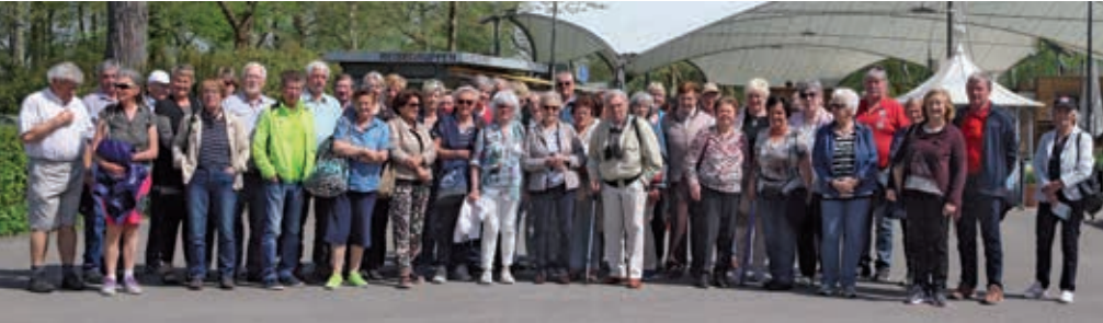
Ausflug zur Insel Mainau