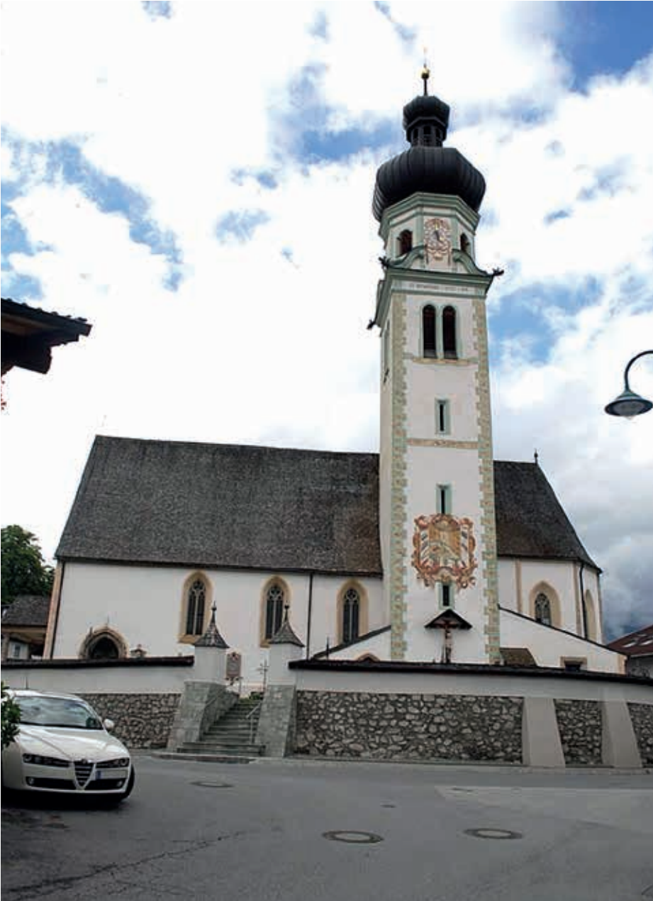
Die Natterer Pfarrkirche