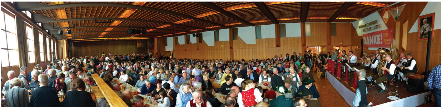
Volles Haus beim Inntalerstammtisch